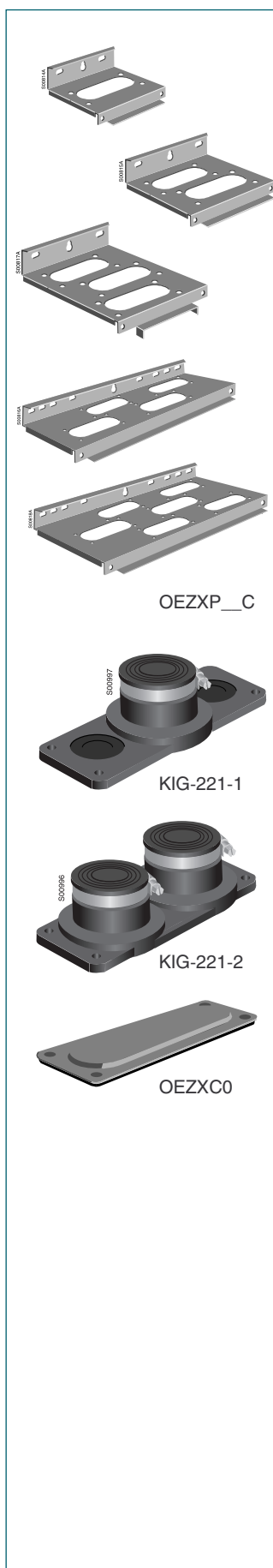
Схема расположения монтажных отверстий

* Сальники KIG-221_ также подходят в качестве фланца II и могут быть установлены на рубильник в пластиковом боксе, например, OT200KFCC3B, выполняя функцию фланца и сальника.