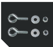
Комплект крепления на трос