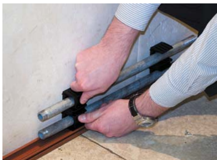
Универсальные держатели крепятся к стене, вплотную к основанию короба. В держателях фиксируются коммуникации