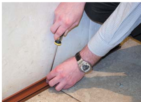
Основание короба крепится к полу, вплотную к стене, замком наружу