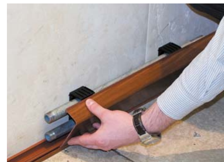
Система закрывается декоративной крышкой