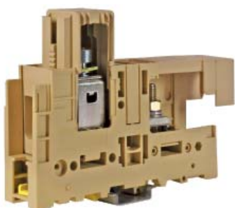
Комбинированный зажим "Гильза - Болт" Внешний вид