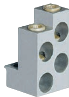
0 262 70