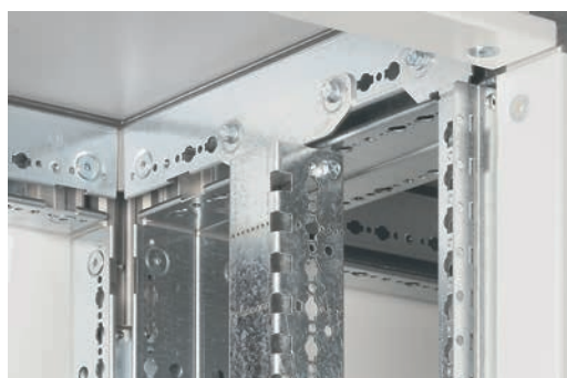
0 205 12

Состав комплекта: - опорная стойка, кат. № 0 205 00; - верхняя панель и основание, кат. № 0 205 03/06/09; - цоколь, кат. № 0 205 17/18/19; - функциональные стойки, кат. № 0 205 13/16; - промежуточная стойка, кат. № 0 205 20.